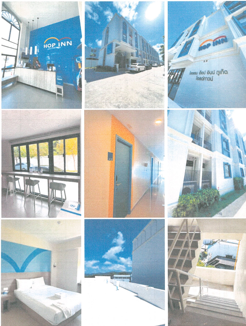
รูปภาพที่ 1.4 การใช้พื้นที่ของโครงการ